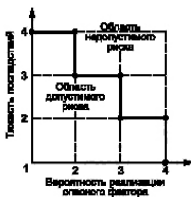
Рисунок Б.1 — Диаграмма анализа рисков

Если точка лежит на границе или выше границы, фактор учитывают, если ниже — не учитывают.